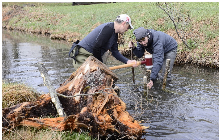
Fischer setzen sich für den Erhalt des Lebensraumes ein.

Die Gründe dafür sind mannigfaltig: verbaute Gewässer, die Schwall-Sunk-Problematik, Prädatoren wie fischfressende Vögel, der Klimawandel, aber auch der hohe fischereiliche Druck. Mit der Revision der kantonalen Fischereigesetzgebung soll versucht werden, den Negativtrend zu stoppen. So